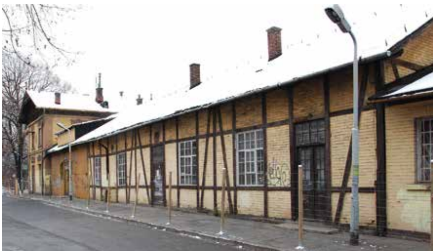
Burmistrz Miasta czyni starania o bezpłatne przejęcie należących do PKP dwóch działek, na jednej z nich znajduje się budynek zabytkowego dworca.

W przypadku przejęcia nieruchomości, w budynku dworca planuje się odtworzenie funkcji komunikacyjnej, rozumianej jako zapewnienie podróżnym oczekującym na pociąg lub autobus dostępu do poczekalni, toalet, a w dalszej perspektywie także restauracji.