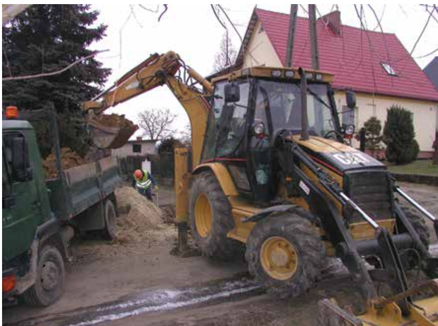
W trakcie prowadzonych prac.