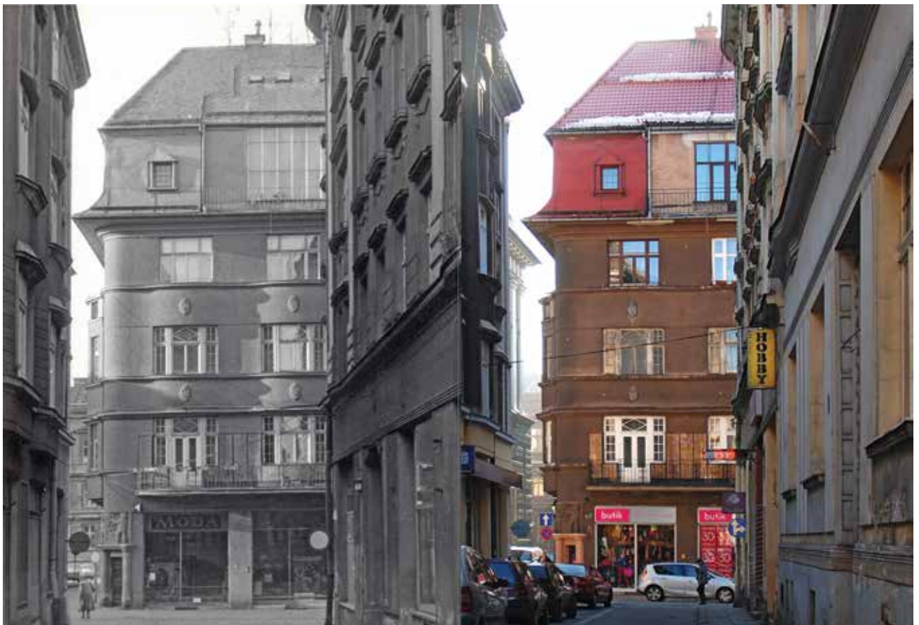
Położoną przy pl. Świętego Krzyża 1 kamienicę własną architekta Eugena Fuldy wzniesiono w 1912 r. na miejscu budynku, w którym urodził się Leopold Jan Szersznik. W kamienicy znajduje się nieczynna, zabytkowa winda. Rok 1983 i 2012.

Zapraszamy Czytelników do współredagowania tej kolumny. Prosimy o nadsyłanie ciekawostek związanych z Cieszynem (np. anegdot, przepisów kulinarnych, zdjęć, dokumentów, wzorów rękodzieła artystycznego itp.), które mogłyby zainteresować innych i wzbogacić wiedzę o naszym mieście. Gwarantujemy zwrot wszystkich otrzymanych materiałów.