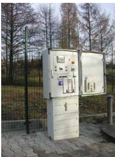
Przepompownia (ul. Owocowa).