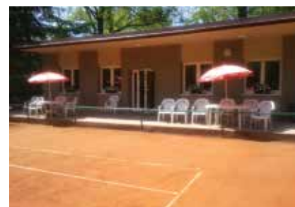
Zakończenie realizacji projektu przewidziane jest na koniec grudnia br.

Ten wspólny projekt, z jednej strony jest efektem potrzeb obu klubów jak również wieloletniej, przyjacielskiej współpracy, która w 2011 roku zaowocowała podpisaniem Umowy Partner-