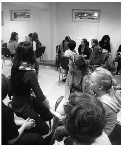
Tegoroczna SzWP koncentrowała się na kształtowaniu właściwych postaw społecznych.

Zakończyła się już XVII edycja Szkoły Wczesnej Profilaktyki organizowana przez Miejski Ośrodek Pomocy Społecznej w Cieszynie, we współpracy z Gimnazjum nr 3 z Oddziałami Integracyjnymi w Cieszynie, Szkołą Tańca „Impulso” oraz Stowarzyszeniem Cieszyńskiej Młodzieży Twórczej.