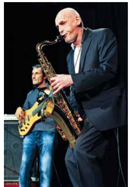
Jazzowe występy publiczność nagradzała gromkimi brawami.

szyński Ośrodek Kultury „Dom Narodowy”, KaSS „Strzelnica”, miasto Cieszyn i Czeski Cieszyn.