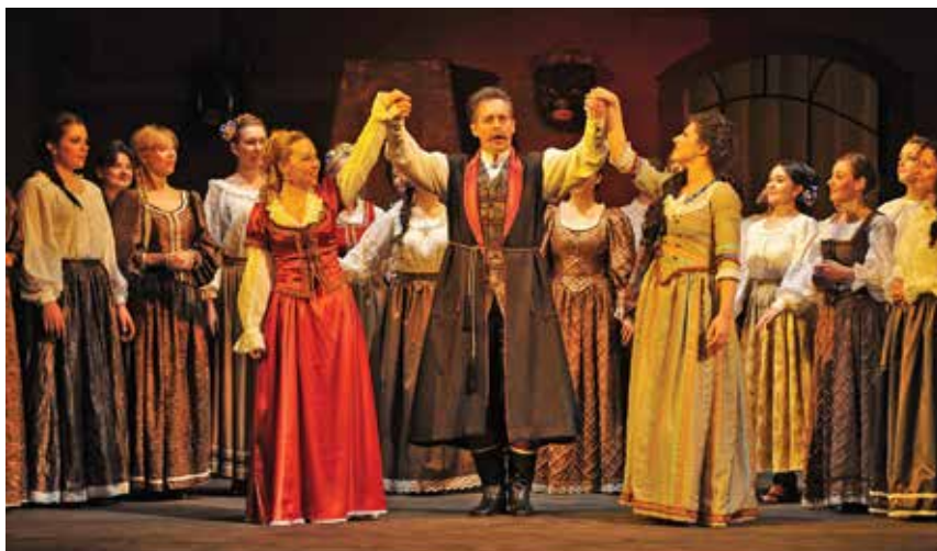
Operę „Straszny dwór” na deskach cieszyńskiego teatru zobaczymy 28 grudnia.

28 grudnia o g. 19.00 Opera Śląska w Bytomiu wystąpi w cieszyńskim teatrze ze swoim przedstawieniem „Straszny dwór” Stanisława Moniuszki.