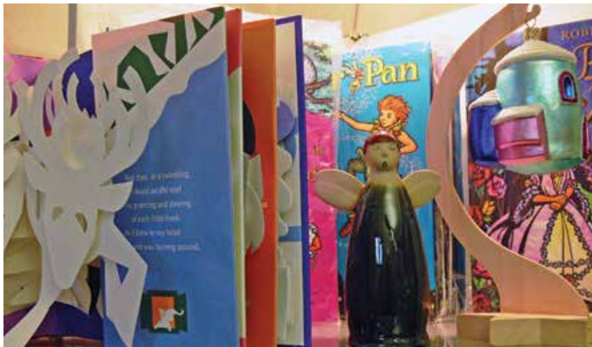
W Informacji Turystycznej Zamku Cieszyn można kupić ciekawe upominki.

jektantami. Stworzone przez nich przedmioty to ciekawy pomysł na upominki dla rodziny, przyjaciół, kolegów z pracy. Może zamkowe wydawnictwo „Cieszyńskie ciasteczka”? Albo trójwymiarowe książki Roberta Sabudy? A może bombki: Cieszyńianka lub Rotunda? W poszukiwaniu wyjątkowych upominków i inspiracji, zapraszamy do zamkowego sklepu w Informacji Turystycznej. Zamek Cieszyn