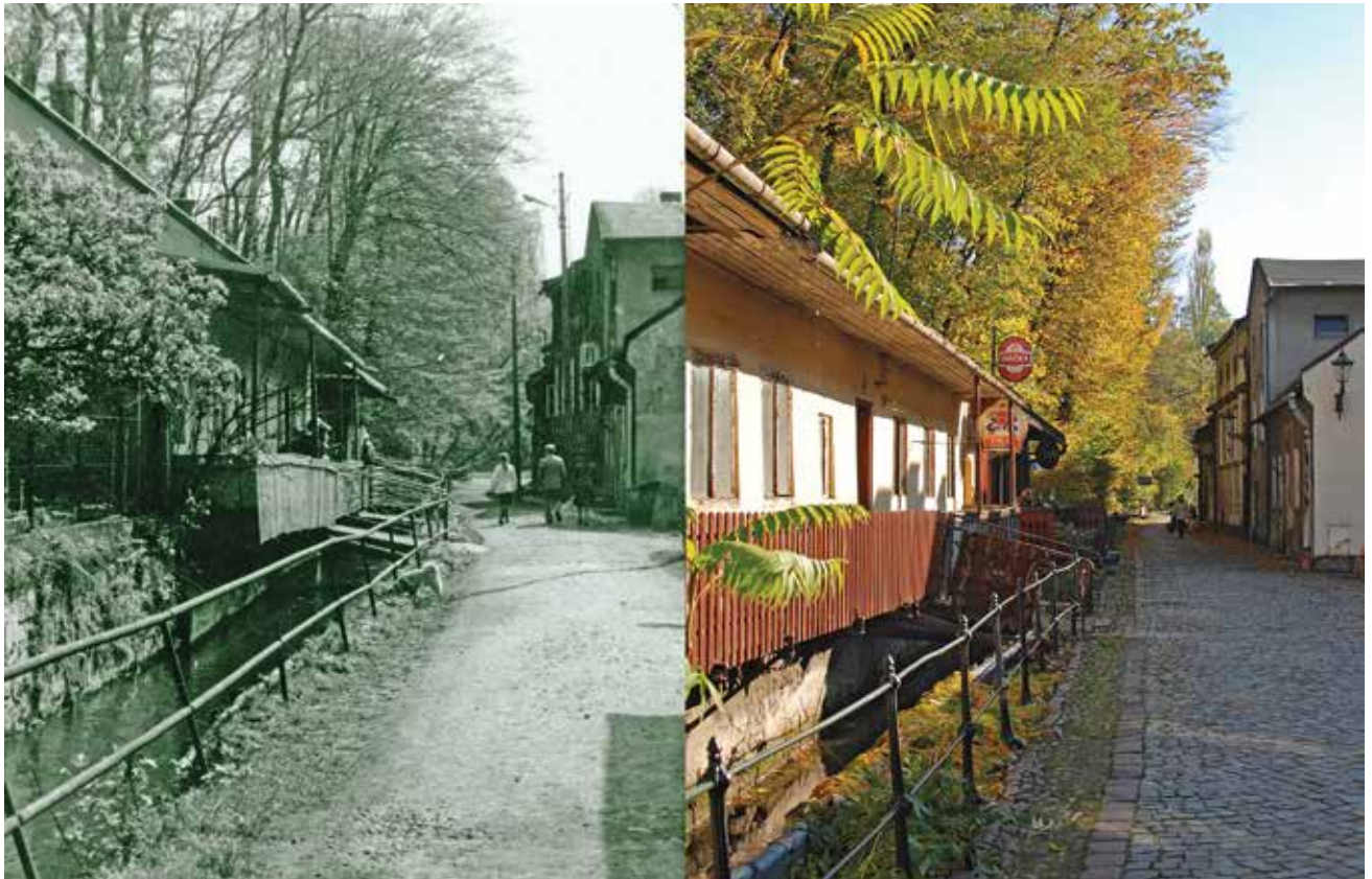
Cieszyńska Wenecja – położona nad potokiem Młynówka charakteryzuje się zabudową niskich domów z drewnianymi galeryjkami i mostkami. Jest to dawna dzielnica tkaczy, garbarzy, sukienników i kowali. Rok 1982 i 2012.