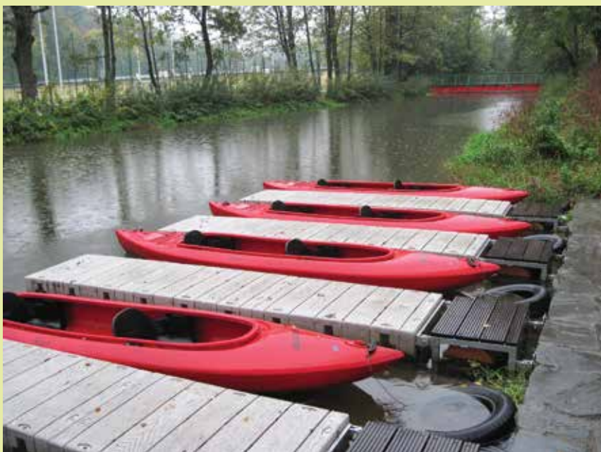
Zalew kajakowy.

czynszu nie przekracza 15 zł. Stawka ta zostanie zwiększona o obowiązującą stawkę podatku VAT (aktualnie 23 %). Dzierżawca zobowiązany będzie ponadto do ponoszenia świadczeń na rzecz Spółki Wodnej dla utrzymania Młynówki Cieszyńskiej zgodnie z § 14 statutu Spółki.