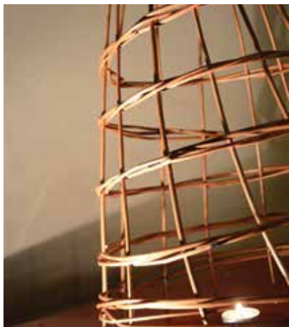
Do 10 grudnia trwają zapisy na warsztaty wikliniarskie.